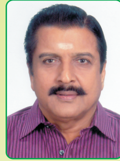
கொங்குமாமணி - 2012